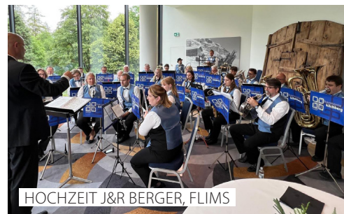
HOCHZEIT J&R BERGER, FLIMS