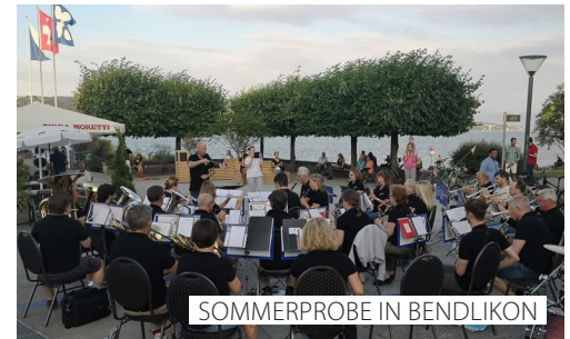
SOMMERPROBE IN BENDLIKON