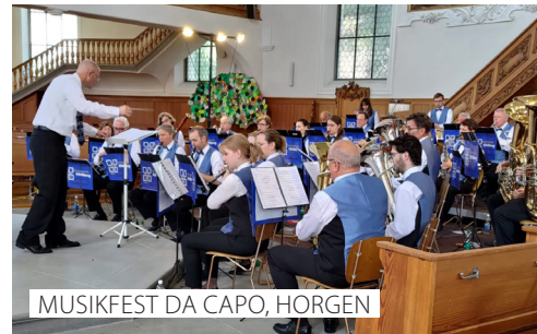
MUSIKFEST DA CAPO, HORGEN